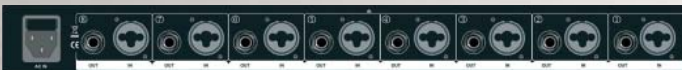
Die Rückseite des VU8