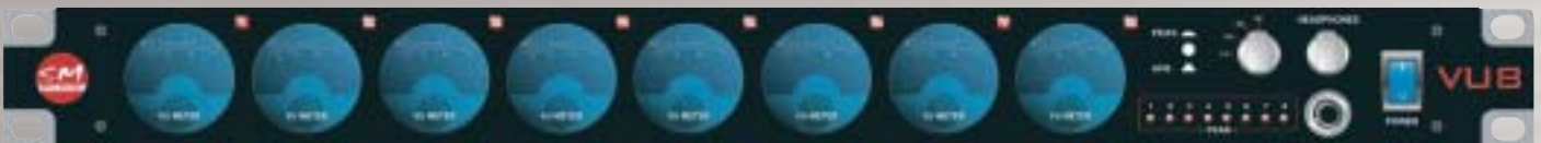
Die Vorderseite des VU8

Auch wenn Sie den VU8 auf Ihrem Arbeitsplatz (Schreibtisch, etc.) nutzen können, empfehlen wir Ihnen dennoch den Betrieb in einem 19"-Rack.